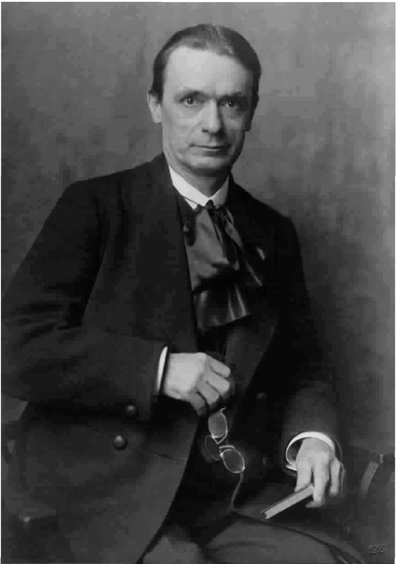
Rudolf Steiner, 1916