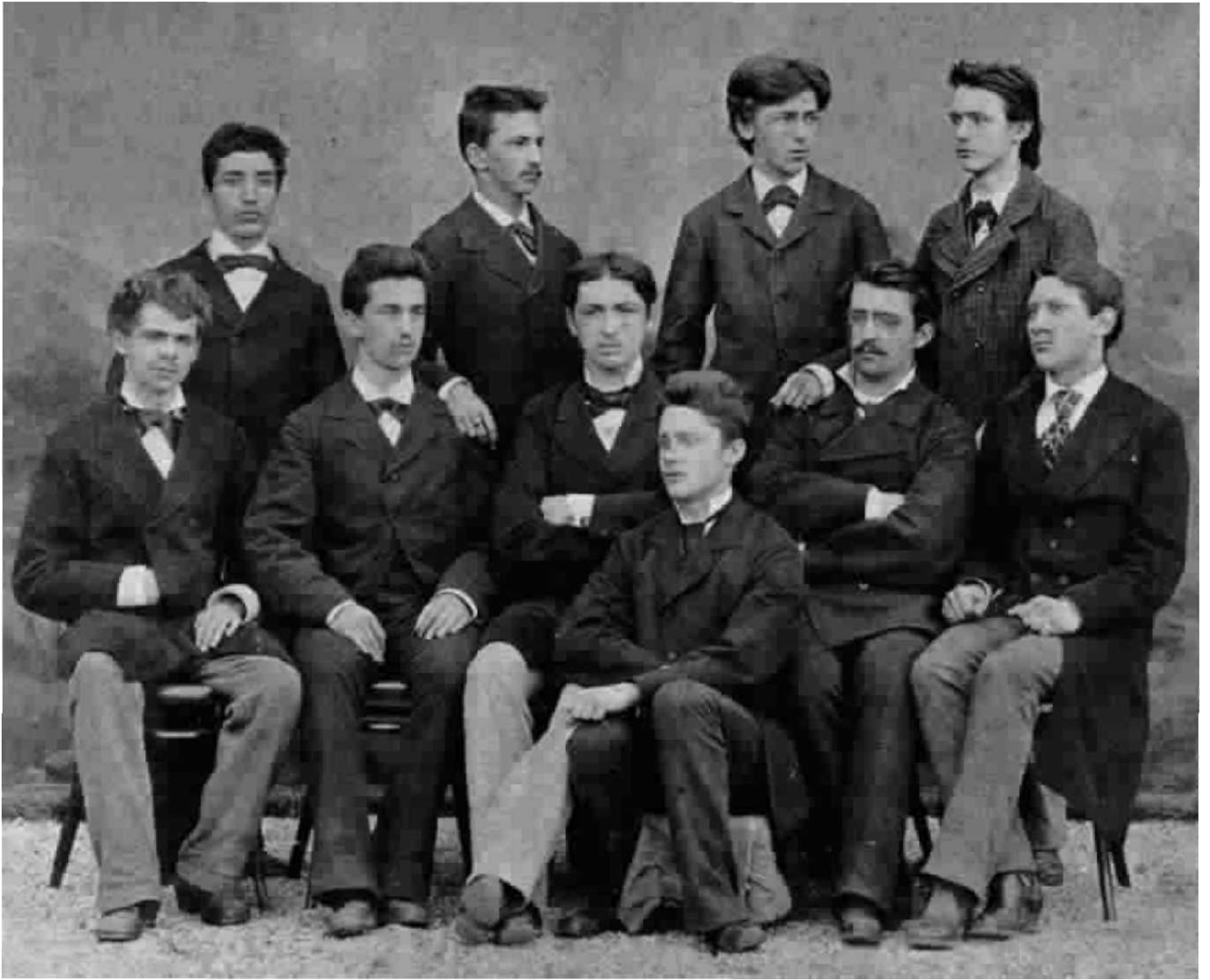
Rudolf Steiner als Maturand (hintere Reihe, rechts)

Folgende Seite: Die Technische Hochschule in Wien