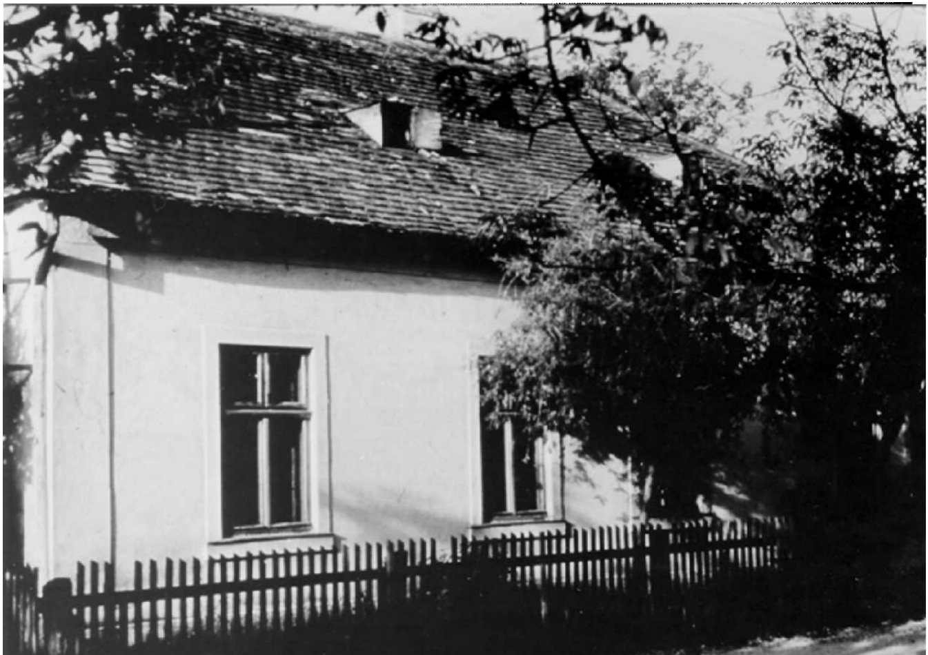
Wohnung der Familie Steiner im Stationsgebäude von Pottschach