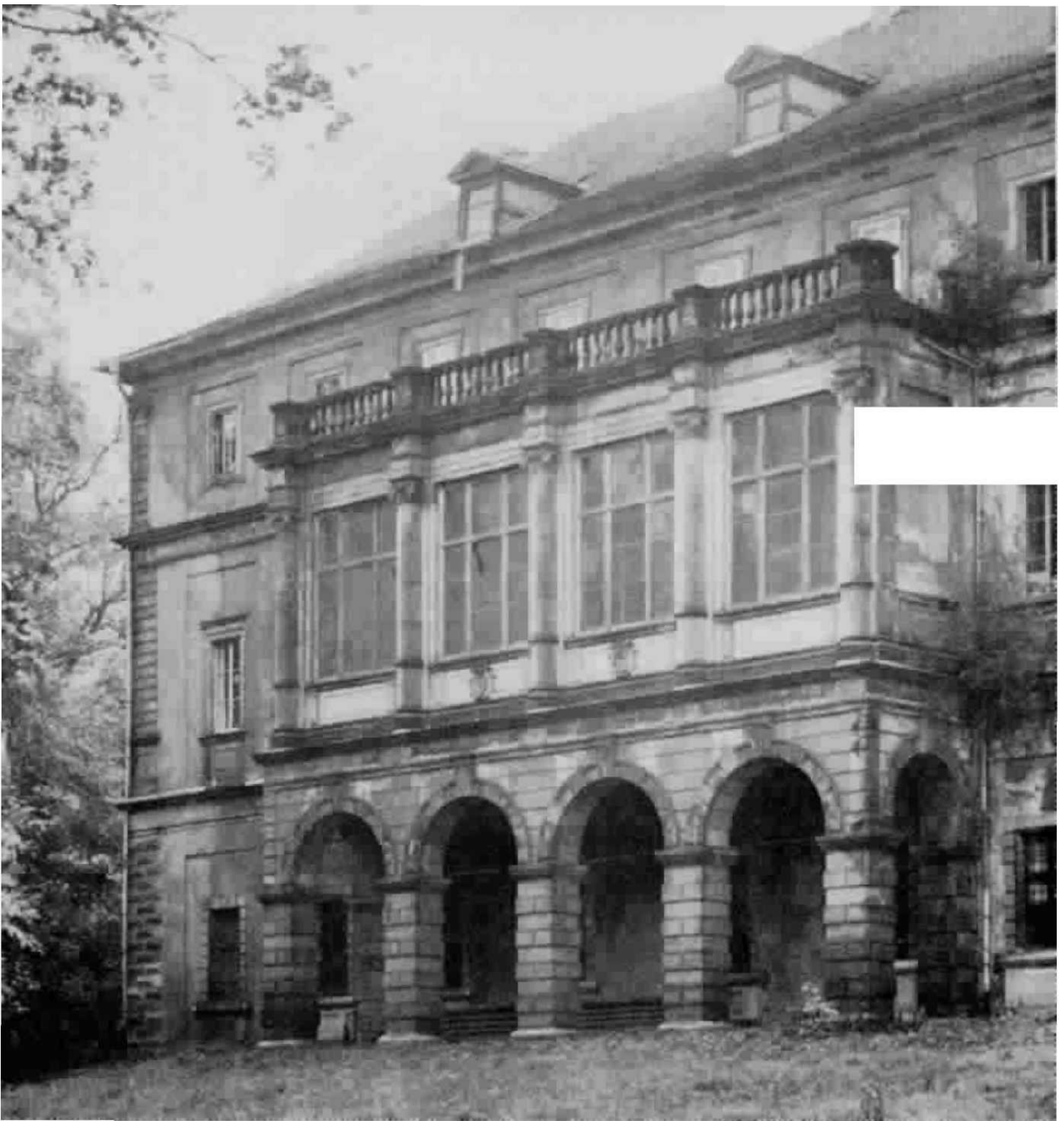
Nordost-Ecke des Weimarer Schlosses. Im 2. Stockwerk befand sich das Goethe-Archiv, das 1897 in das neue Gebäude oberhalb der Um umsiedelte.