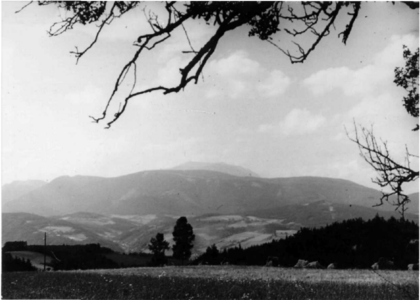
Pottschach mit Blick auf den Semmering