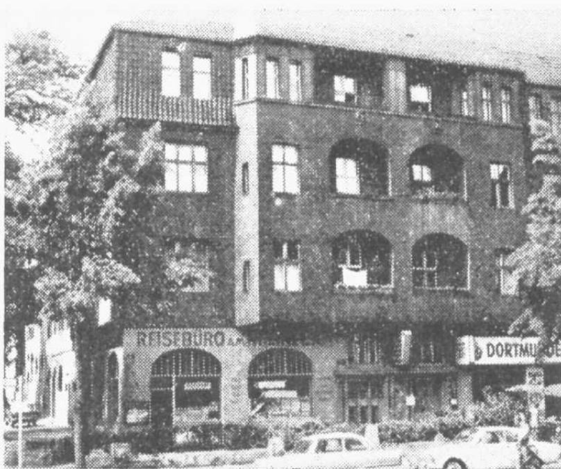
Haus in der Kaiserallee 95