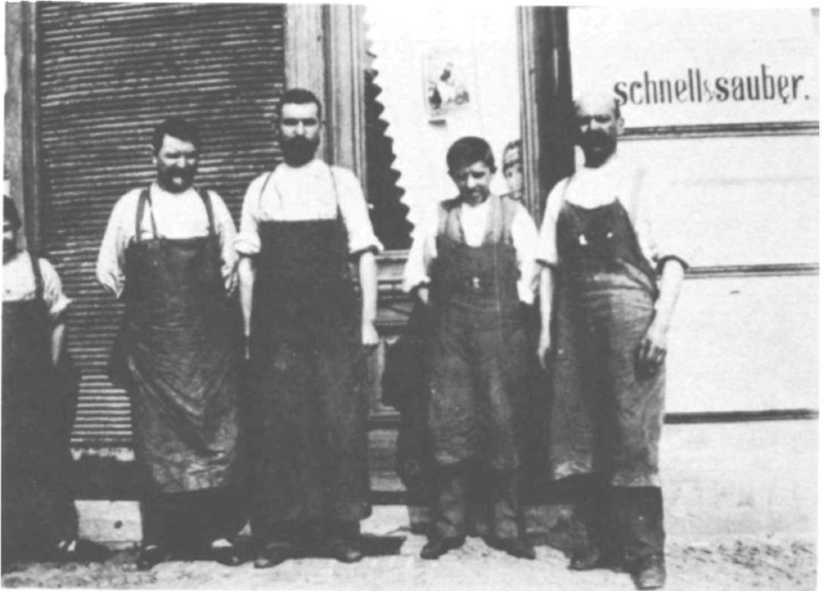
Berlin um 1900 (Foto: Heinrich Zille, 1858 – 1929)