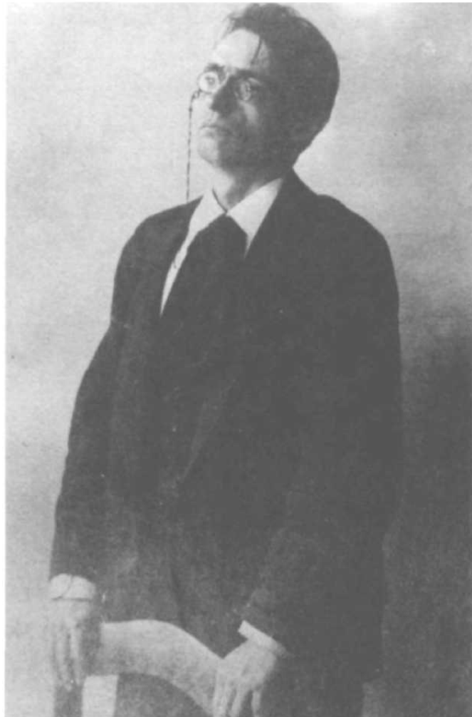
Rudolf Steiner um 1900