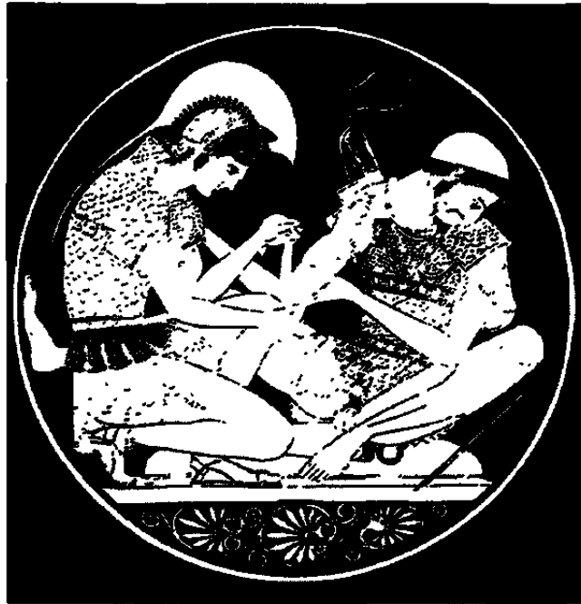
Achilleus verbindet den vom Pfeil getroffenen Patroklos

funden. War das Leitmotiv des Helfens in früheren Zeiten das der Barmherzigkeit, so ist Helfen heute soziale Pflicht. Wer ihr nicht nachkommt, kann wegen unterlassener Hilfeleistung gerichtlich belangt werden.