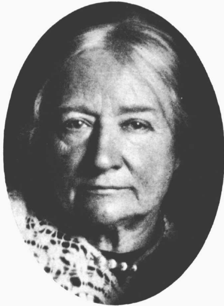
Ellen Key 1919, siebzigjährig